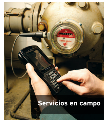
Servicios en campo