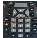
Número solamente (modelo S)