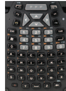
Completo alfanumérico ABCDEF (modelo C)