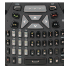
Completo alfanumérico Qwerty (modelo S)